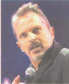
MÚSICO. Bosé también ha sucumbido a los avances capilares.