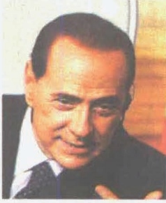
POLÍTICO. Berlusconi se aplicó el llamado 'cover-up'.