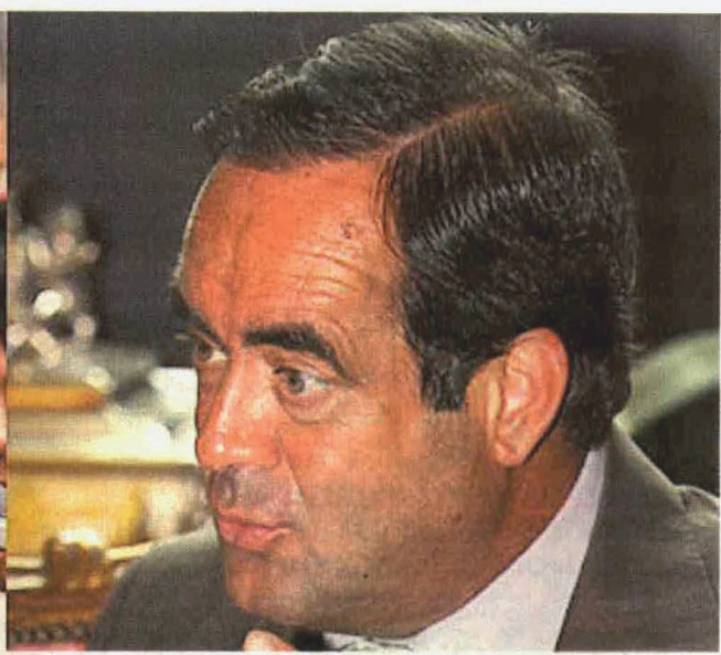
INTERVENCIÓN. José Bono sorprendió a todos con una imagen renovada tras las vacaciones del pasado verano.

El cambio de 'look' del presidente del Congreso ha hecho que se tripliquen los implantes capilares. Son el último paso, antes hay otros tratamientos para frenar la caída del cabello