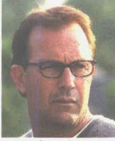
ACTOR. Costner luce ahora un aspecto más juvenil.

mientos capilares. Proteínas y oligoelementos son algunos. Al fin y al cabo, se trata de «regenerar el bulbo, revitalizando los de peor estado», aclara la especialista en Tricología y miembro de la Sociedad Española de Medicina Estética.