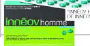
"INNÉOV HOMME", DE INNÉOV (29 €).