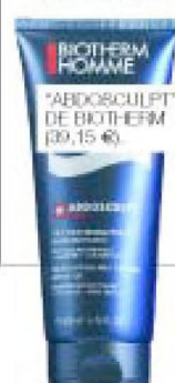
"ADOSCULPT", DE BIOTHERM (39,15 €).

El cuidado corporal del hombre va mucho más allá de lucir los tpicos abdominales, puesto que ya abarca incluso la depilación en zonas específicas como puede ser espalda y hombros. Preocupados cada vez más por una alimentación sana y el ejercicio frecuente, no siempre es posible con los ritmos de trabajo establecidos. Esto provoca que las células adiposas situadas alrededor del perímetro abdominal se hinchen y cojan un volumen de hasta 50 veces su tamaño normal. Este fenómeno estético, muy vinculado al cuerpo masculino, puede darse también en los pectorales y en los glúteos. Eliminarlos no es fácil, pero la cosmética o los parches adelgazantes pueden ayudar a la auto-combustión de grasas limitando su acumulación, al tiempo que ejercen una acción reafirmante.