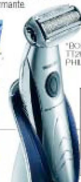
"BODYGROOM TT2022", DE PHILIPS (50 €).