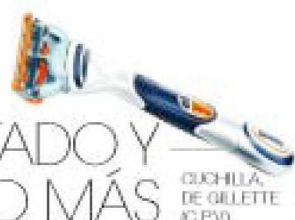
CUCHILLA DE GILLETTE (C.P.V.)

El hombre sigue con mucho interés las últimas novedades en materia de afeitado, y no es para menos. Quien ha de librarse del pelo de su barba a diario puede llegar a invertir un total de 780 horas en este cometido a lo largo de su vida. Para conseguirlo, siguen en alza las máquinas de afeitado con su oferta de diseño y altas prestaciones. Pero la estrella de la comodidad es la cuchilla recargable o desechable, de cinco hojas. Cada vez más precisas, consiguen un afeitado apurado con menos cortes.